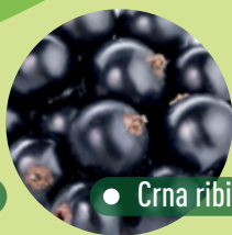
● Crna ribizla