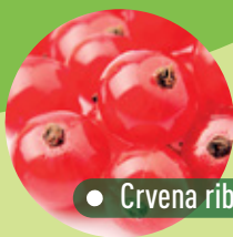
● Crvena ribizla